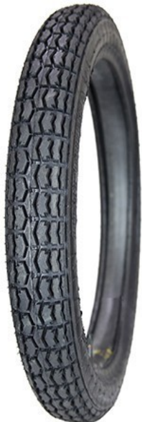
Рисунок протектора позволяет осуществлять хорошее сцепление с различным дорожным покрытием, высокую устойчивость и управляемость мотоциклом.

Метрическое обозначение - 80/100-18 M/C 52L